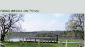
Paukščių stebėjimo vieta (Prienų r.)