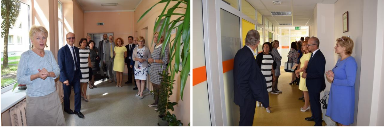
Savivaldybės tarybos nariai Švietimo pagalbos tarnyboje ir „Ažuolo“ progimnazijoje