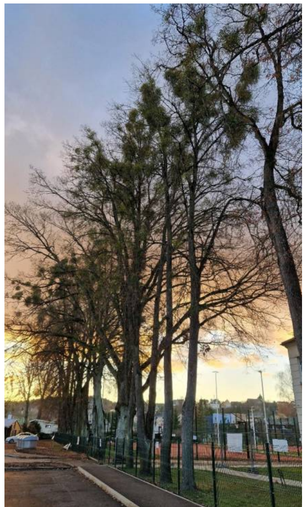
Liepose labai gausu amaly, kurie sekina medžius