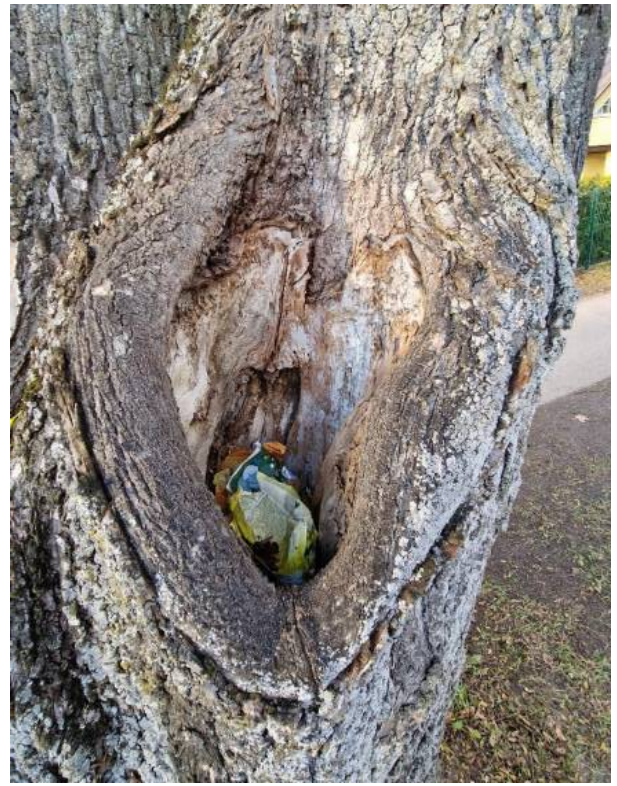
Stambios drevės, centriniai puviniai apatinėje medžių dalyje pavojingi