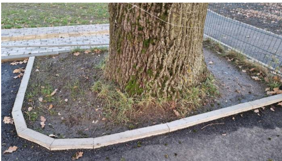
Iš visų pusių įrėmintas storasis ąžuolas, būtina išsaugoti

Medžių skersmuo išmatuotas 1,3 m h skersmens matavimo juosta QUALITATS BANDMASS, medžių aukštis išmatuotas Haglof aukštimačiu Lazer Geo 2.