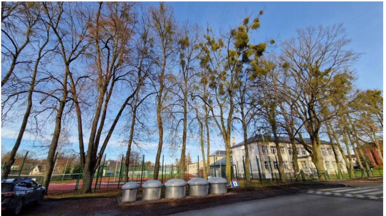
Liepos prie stadiono, arti įrengiant konteinerius buvo pažeista dalis šaknų