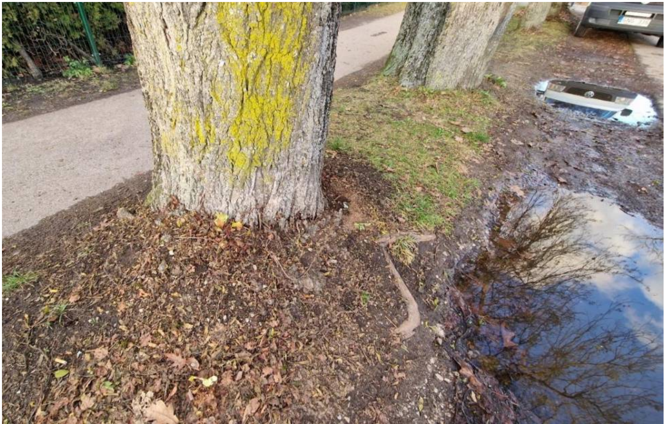
Šaknynas apribotas šaligatvio, kelio, šaknys iškilę į paviršių